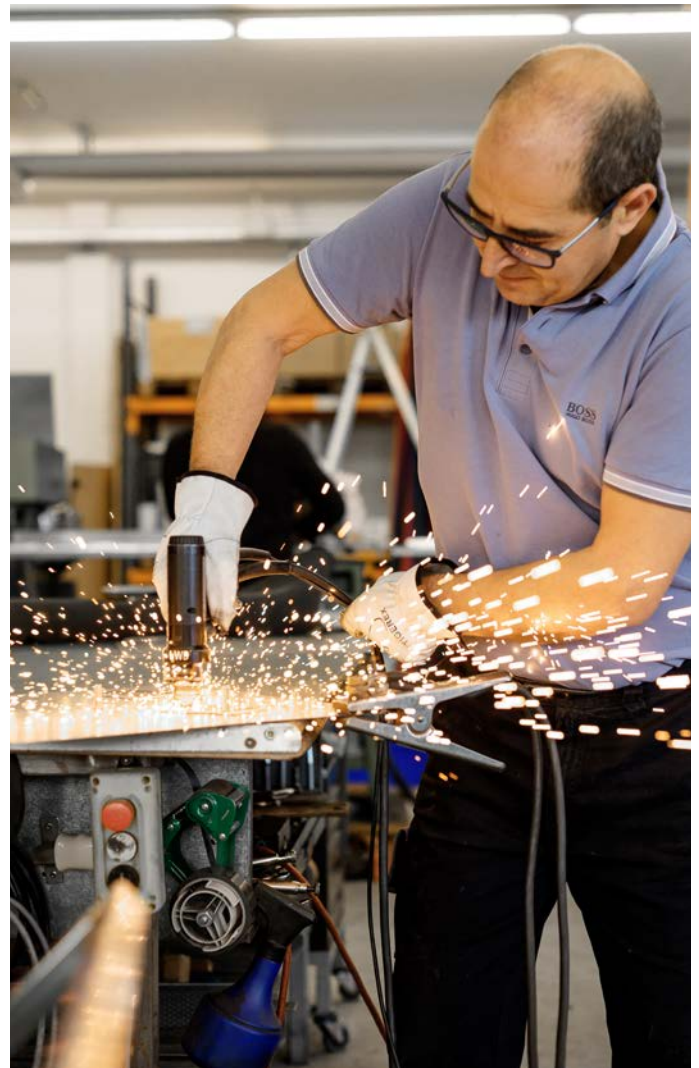
Unifil Produktion, Spenglerei.